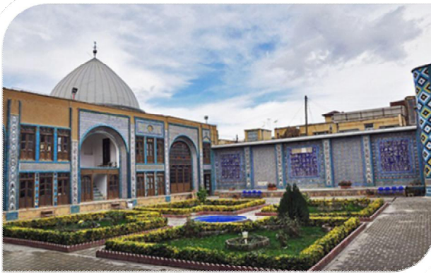
تکیه معاون الملک