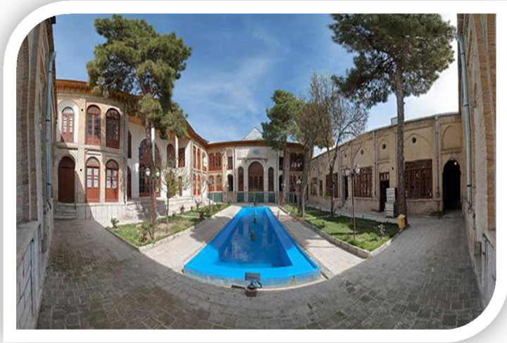
تکیه ییگر بیگی