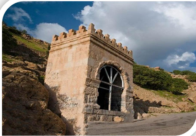
طاق فرهاد (گرا)